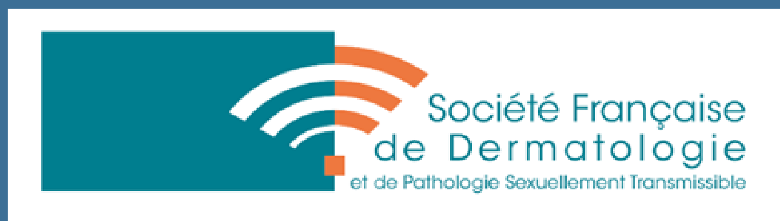
Table ronde autour des résultats d'une enquête grand public auprès de 1800 personnes, organisée par